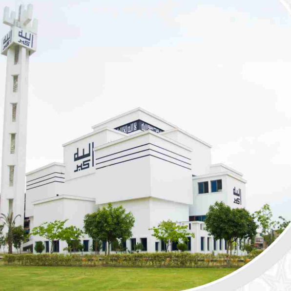
Jamia Masjid Saeed Block-A

☆ اس سکیم میں 60 کنال مختص رقبہ پر قبرستان تیار کر لیا گیا ہے جو روزمرہ ضروریات میں سے ایک ہے۔