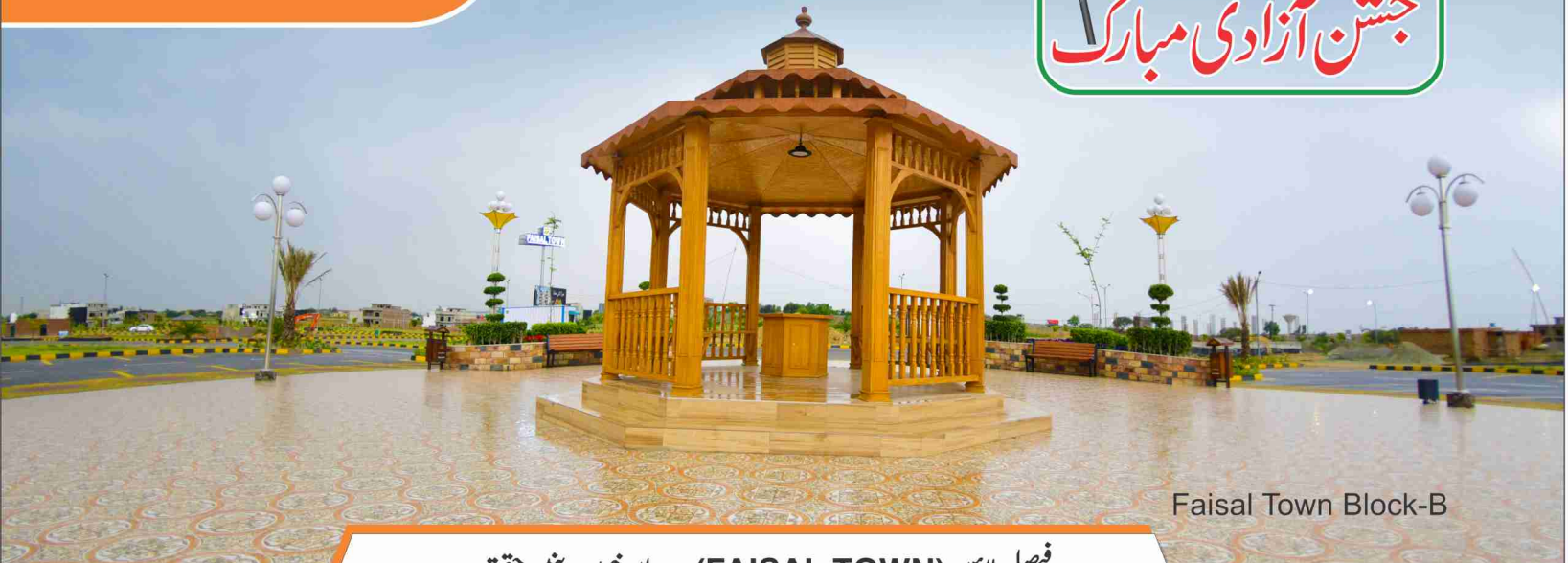
Faisal Town Block-B